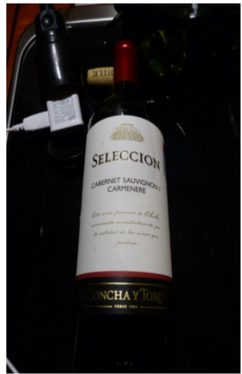
"Bezahlbare", gute Weine