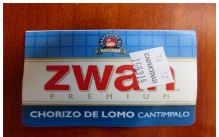
Zwan Choritzo de Lomo Cantimpalo = ähnlich einer Landjäger