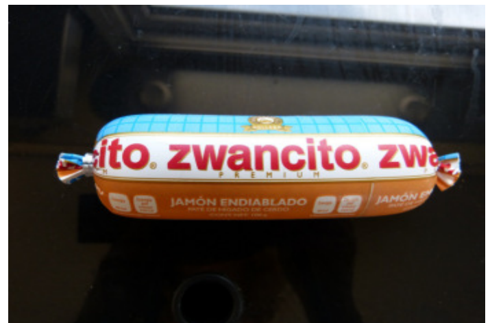
Zwancito Jámón Endiablado = Leberwurst