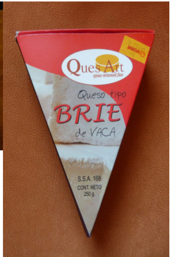
Und andere Sorten der Käsemarke QuesArt: