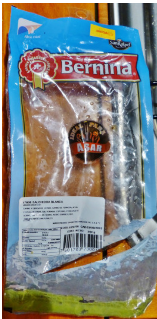
Bernina Salchicha Blanca = ähnlich einer Weißwurst